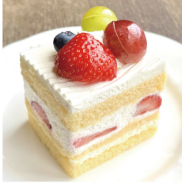
季節のショートケーキ